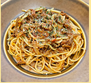
aomori burdock meat sauce コク旨! 青森県ごぼうの ミートソース 1,200yen