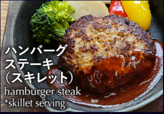
ハンバーグステーキ (スキレット) hamburger steak *skillet serving

ライス 250yen (single item menu) スープ 100yen (single item menu)