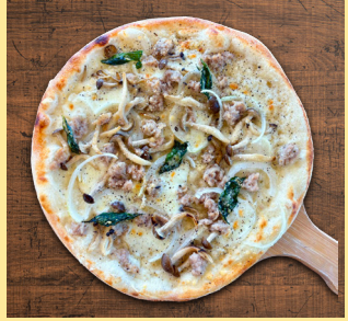
mozzarella and basil tomato sauce サルシッチャ ビアンカ 1,600yen