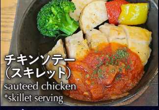
チキンソテー (スキレット) sauteed chicken *skillet serving

単品スキレット プレート 1人前 800yen 1,100yen single skillet serving (1 person) plate item menu 2人前 1,500yen single skillet serving (2 person)