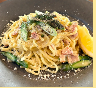
rich cream pasta with aomori asparagus 青森アスパラの濃厚クリームパスタ ~生レモンで爽やかに~ 1,400yen